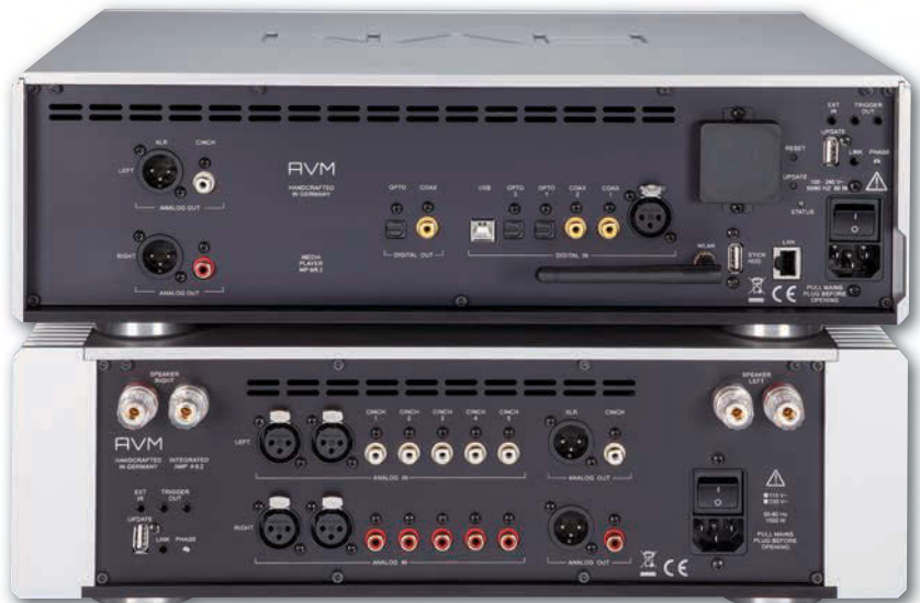
▲ Anschlussseitig dürften bei der AVM-Anlage kaum Wünsche offen bleiben. Verstärker und Player werkeln arbeitsteilig. Lediglich ein Plattenspieler bräuchte externe Verstärkung.

Anders als bei den kleineren Serien verzichtete man für die 6.2 auf die optionalen Einschübe etwa für Phono oder Radio, da sich die enorme Ausgangsleistung