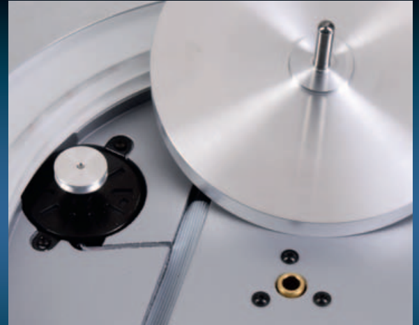
INNERE SCHÖNHEIT: Der Teller rotiert auf einem Lager aus Bronze, der Riemen wird über einen zweiten, passiven Außen-Pulley gespannt.

Zarge aus hochverdichteter Holzfaser. Die ist schwer und der erste Schritt gegen böse Vibrationen, verstärkt wird sie durch eine Haut aus Aluminium. Alles lagert federnd auf höhenverstellbaren Füßen.