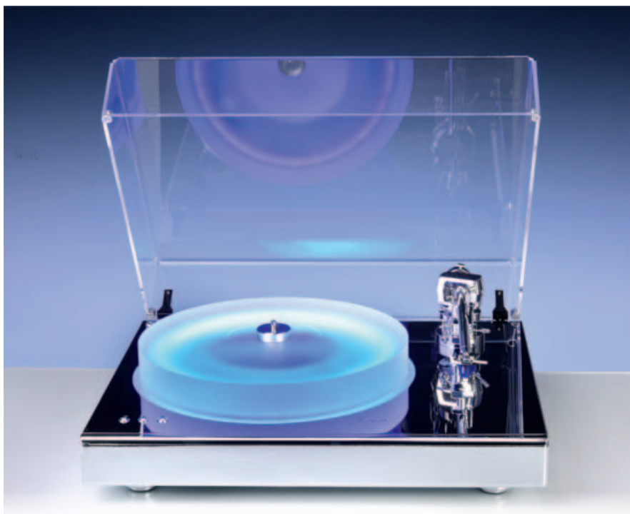
SCHUTZBEDÜRFTIG: AVM liefert den R 5.3 mit einer Haube aus Acrylglas aus. Wer klangsensibel ist, nimmt sie im Betrieb ab.

kommt nicht an die Präsenz der superben Vinyl-Pressung heran. Was ein Plattenspieler hier leisten muss: Ruhe und die ganz große Ausbeute an Feindynamik. Der AVM R 5.3 vereinte beides, es herrschte der maximale Kontrast, die Kraft der Schattierungen. Zudem eine aufreizende Leichtigkeit – die Trompete von Till Brönner erschien mit charmanter Strahlkraft vor den Membranen.