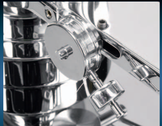
BIS INS KLEINSTE DETAIL: Der 10-Zoll-Tonarm wird kardanisch gelagert. Das Antiskating stellt man über ein Gegengewicht an der Basis ein.