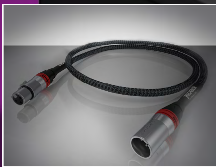
Ricable Magnus XLR