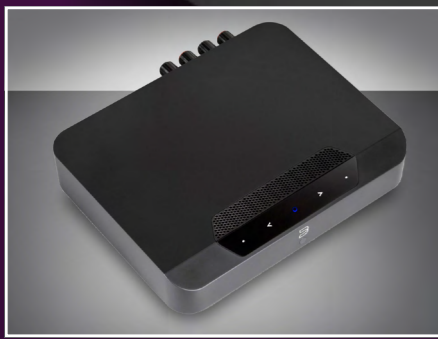
Bluesound Powernode Edge