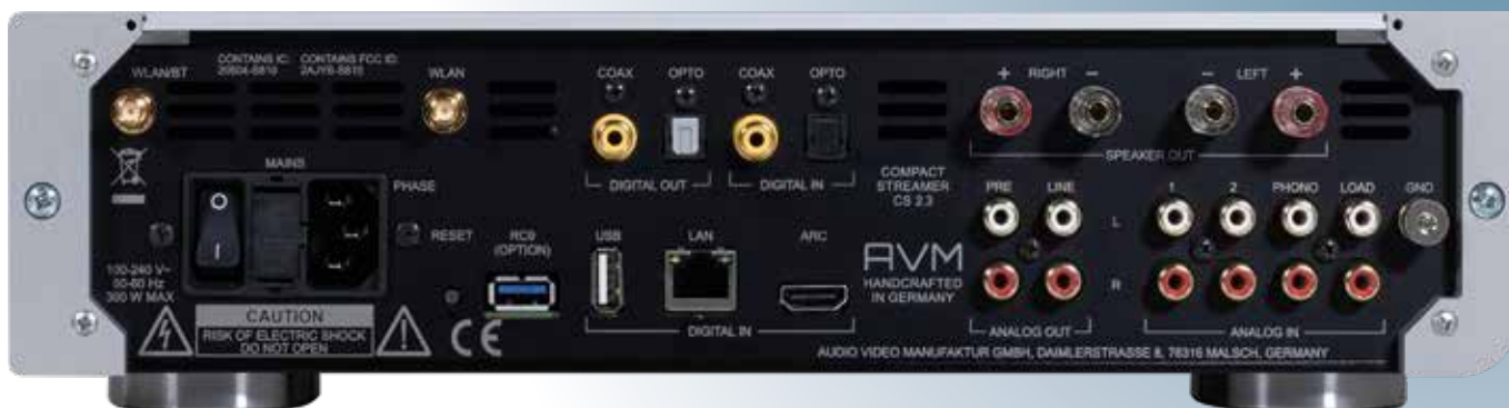
Die Rückseite ist üppig bestückt. Für jeden Anlass und für jedes Bedürfnis sollte sich der passende Anschluss finden. Von Netzwerk, analog, digital, HDMI, Phono und vieles mehr, lässt der Inspiration keine Wünsche offen

bis zu 140 Watt auf die Membran geschossen. Maximale Leistungsaufnahme: 900 Watt!