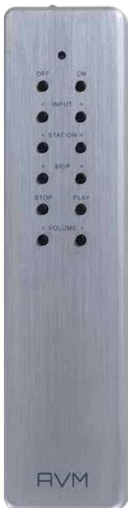
Eine klassische Fernbedienung liegt den neuen AVM Inspiration CS 2.3 Geräten nicht bei. Wer tatsächlich darauf besteht, zahlt 190 Euro extra

der Frontseite ist nämlich auch nicht von schlechten Eltern. ■