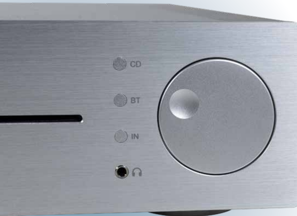
Die Front des kleinen Inspiration ist noch feiner und edler verarbeitet, als die Vorgängerversion. Spaltmaße und Haptik, die Gänsehaut garantieren

ein komplett eigenständiges Framework erschaffen, um unabhängig von Drittanbietern die eigenen Ideen umsetzen zu können. Dabei ist AVM ein großes Risiko eingegangen, denn Softwareentwicklung ist richtig teuer, dafür, dass man am Ende „nichts in der Hand“ hat. Aber die Investition hat sich gelohnt. Die Steuerungs-App ist nicht nur wunderschön aufgeräumt, sie ist auch noch extrem schnell und stabil. Die interne Audioverarbeitung auf allerhöchstem Niveau. Die Einrichtung ist kinderleicht. Den AVM per Google Home integrieren, App öffnen, loslegen. Den kompletten Funktionsumfang hier in diesem Artikel zu beschreiben, würde den Rahmen bei Weitem sprengen. Darüber könnte man vermutlich ein ganzes Magazin schreiben. Es sei Ihnen versichert: Sie werden nichts vermissen. Keinen Anbieter, keine Schnittstelle. Auf einige wenige Details, die aus unserer Sicht hervorstechen, möchten wir aber natürlich trotzdem kurz eingehen. Neben CD und klassischen Audioformaten über das Netzwerk kann der CS 2.3 dank selektiertem ESS Chip nämlich auch DSD128 wiedergeben, er ist mit einem HDMI-(ARC) ausgestattet und sogar eine MM- und MC-Phono-Vorstufe hat noch im Gerät Platz gefunden. All die Signale werden am Ende mit