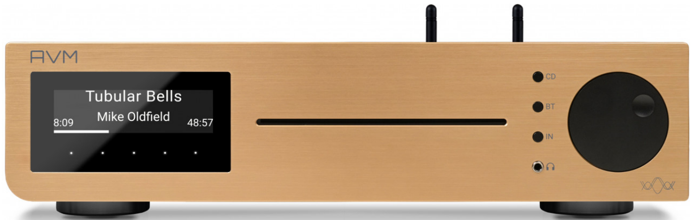
Der CS 2.3 von AVM liefert viel Leistung. Ihn gibt es jetzt in der Bronze-Sonderedition.