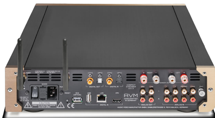
Der AVM Inspiration CS 2.3 mit reichhaltiger Anschluss-Heckpartie

Im Zentrum der Komponenten arbeitet AVMs hauseigene X-STREAM Engine. Sie ermöglicht die Verarbeitung hochauflösender Musikdaten und unterstützt unmittelbar zahlreiche Streamingdienste und Plattformen. Dazu zählen AirPlay, Qobuz, Roon Ready, Spotify, TIDAL Connect MAX (FLAC bis zu 24-Bit/192 kHz) und HighResAudio.